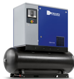
Versione montata su serbatoio con essiccatore integrato