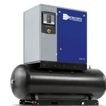
Versione montata su serbatoio