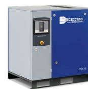
Versione montata a pavimento