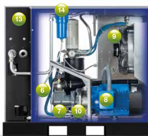
DRB 25 D